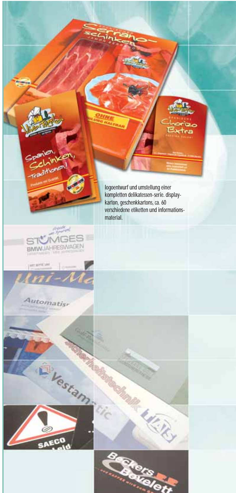
logoentwurf und umstellung einer kompletten delikatessen-serie. display-karton, geschenkkarton, ca. 60 verschiedene etiketten und informationsmaterial.

das ziel eines flyers ist es, ihre botschaft sofort zu vermitteln. im durchschnitt wird ein flyer nicht länger als 5 sekunden betrachtet, es sei denn, er ist für den endverbraucher interessant. vorsicht: flyer sind nicht für jede branche die optimale lösung.