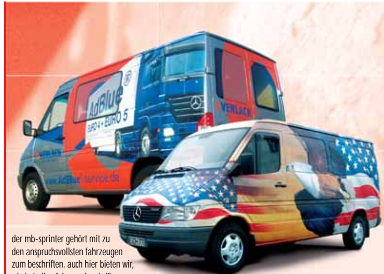
der mb-sprinter gehört mit zu den anspruchsvollsten fahrzeugen zum beschriften. auch hier bieten wir, wie bei allen fahrzeugbeschriftungen, 3 bis 5 jahre garantie.