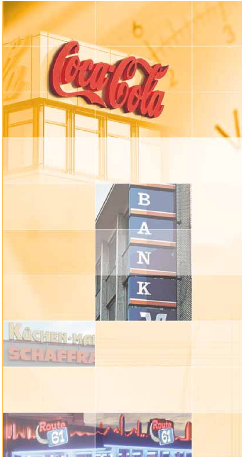
eine gelungene mischung aus indirekter neonbeleuchtung, transparentsystemen mit digitaldruck und sichtbaren neonsystemen.

eine edle art, seinen namen zu zeigen, sind profilbuchstaben und -elemente. verschiedene ausführungsmöglichkeiten, wie direkte oder indirekte ausleuchtung, bringen neuen glanz und stil an ihr objekt. natürlich gibt es auch profilbuchstaben ohne ausleuchtung, die aber auch durch ihre tiefe und ihr schattenspiel beeindrucken.