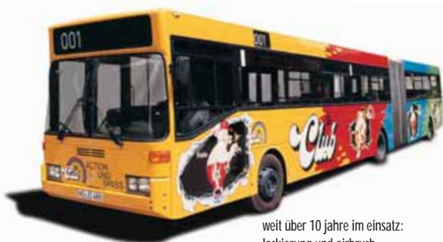
weit über 10 jahre im einsatz: lackierung und airbrush.

bus- und bahnbeschriftungen gehören zum standard eines guten etatplanes. immer variabelere mietverträge mit den verkehrsverbunden bieten zusätzliche möglichkeiten. ob teilbeschriftungen, komplettbeschriftungen oder auch aktionsflächen – werben nach lust und werbebudget.